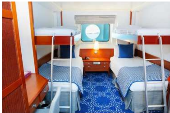
Cabine Interna IB

Cabine 17m 2 com duas camas baixas de solteiro (que podem ser convertidas em cama de casal mediante solicitação com antecedência), banheiro, telefone, secador de cabelo, cofre e TV.