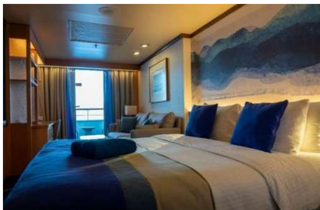
Suite Junior Externa SJB